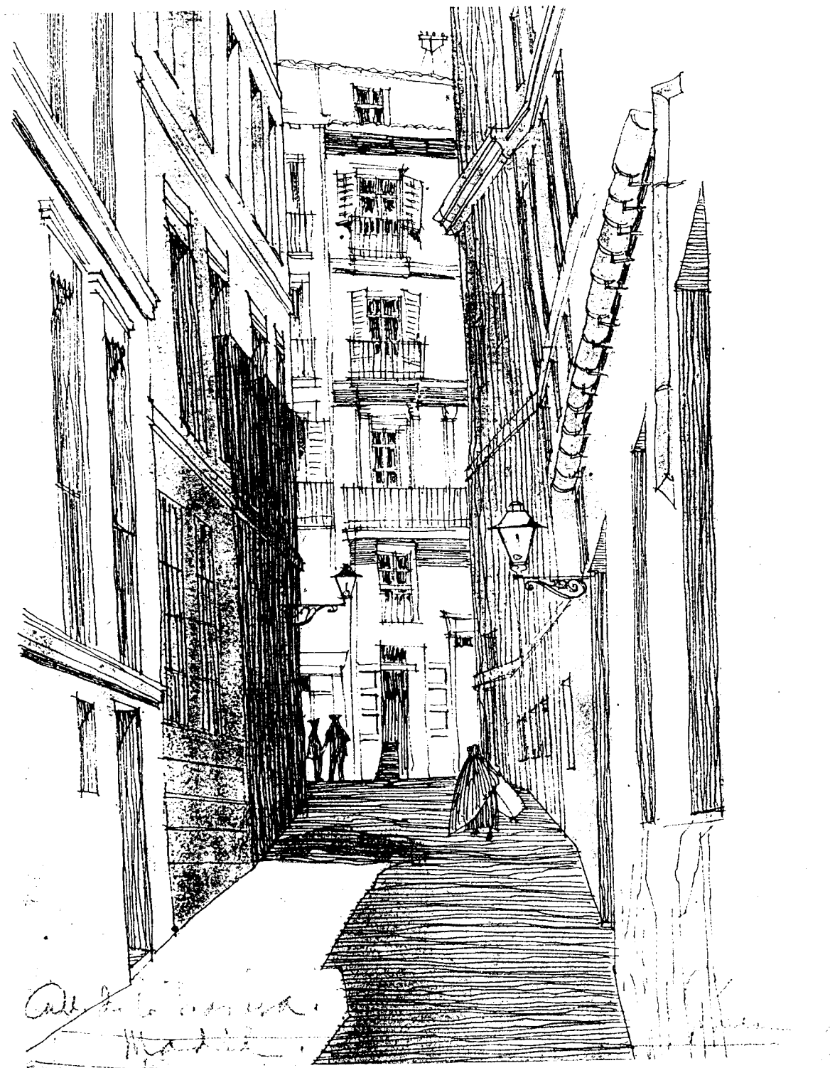
Un aspecto de la calle de la Travesía, de Madrid.