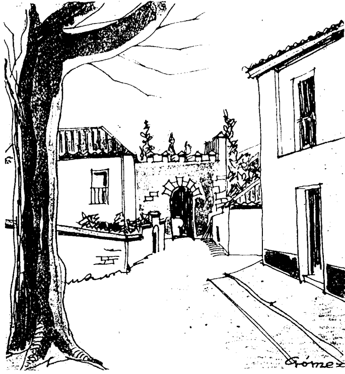
Un rincón de Granada.

A punto de ser ya arquitecto — cursa actualmente el sexto año —, este futuro compañero toma bajo el brazo su álbum de dibujos y apunta, aquí y allá, perspectivas, rincones y "momentos" que impresionan su retina. ¿Qué más da Madrid que Granada, Toledo o cualquier otro bello lugar de España? Lo