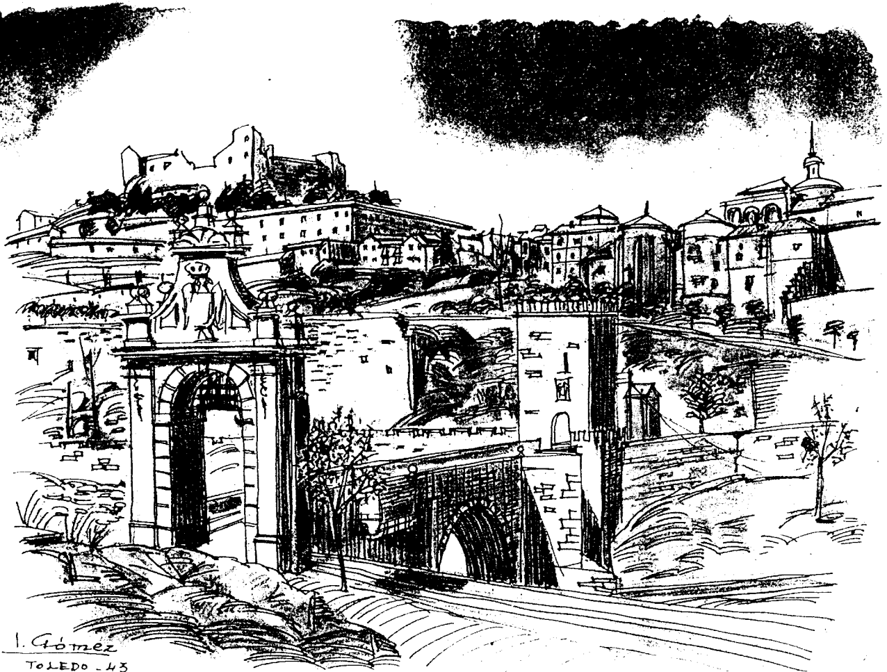
Toledo desde el puente de Alcántara. Al fondo, las ruinas del Alcázar.